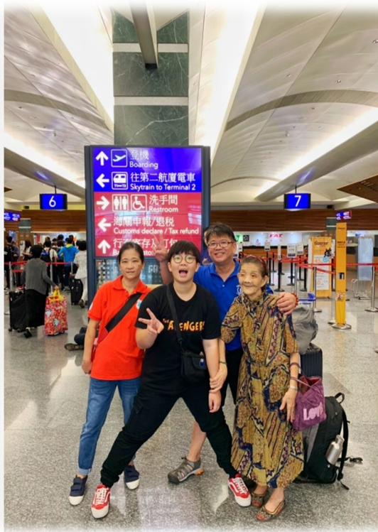
(在機場與家人的合照)