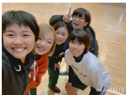
(與日本同學的合照)