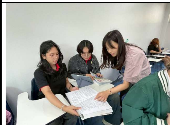
個人教學照—作業指導