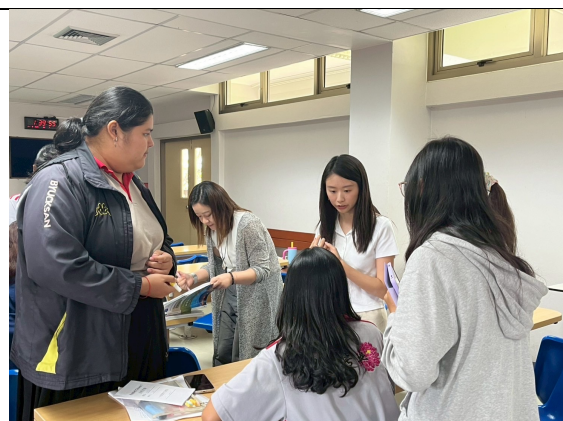
引導學生小組討論