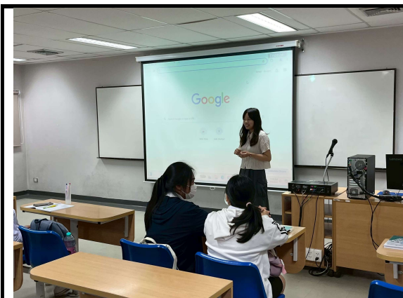
個人教學照—自我介紹