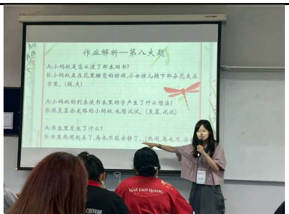
個人教學照—作業解析