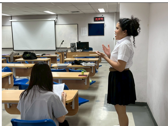
檢核學生背誦課文