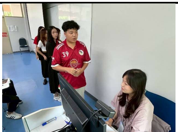
個人教學照—檢核學生背誦課文