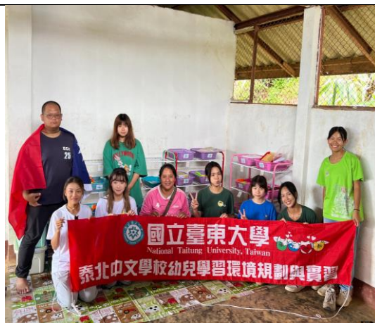
7/30~8/02 大同中學幼兒園小班