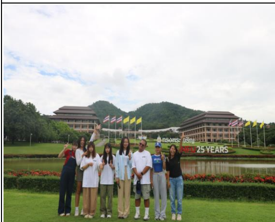
8/3 文化考察：皇太后大學、廟宇