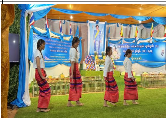
8/12 文化考察：參加母親節活動