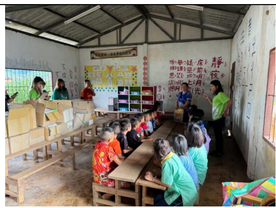
8/13~8/15 大同中學幼兒園大班