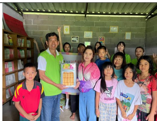
8/5~8/8 大同中學幼兒園中班