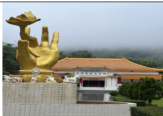
8/9 文化考察：泰北義民文史館