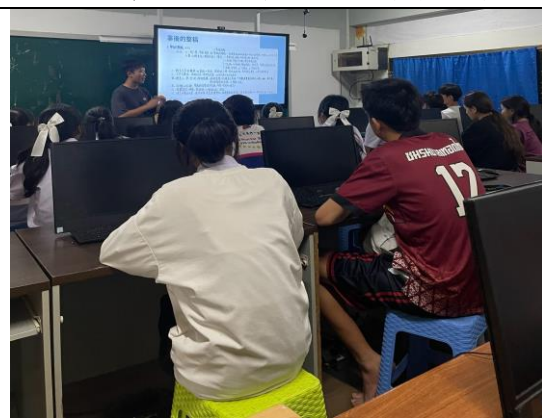
8/19 觀摩他校老師上課（清華大學）