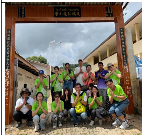
7/26 幼兒園評估環境與開會