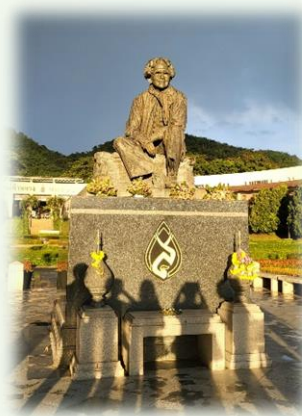
★ 校內的 詩娜卡琳 皇太后雕像