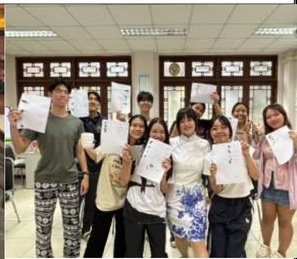
個人文化課教學：中華茶文化