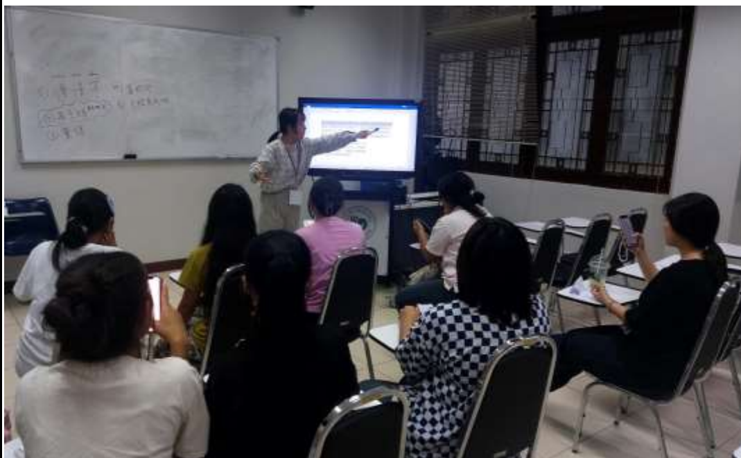
(圖一)語言課上課中。

能有機會到皇太后大學實習，讓第一次出國實習的我、能夠專注於精進自己的教學能力，實在是千載難逢的機會！