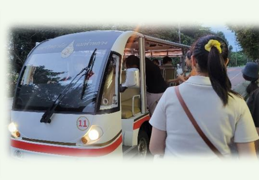
★校內小白車初體驗