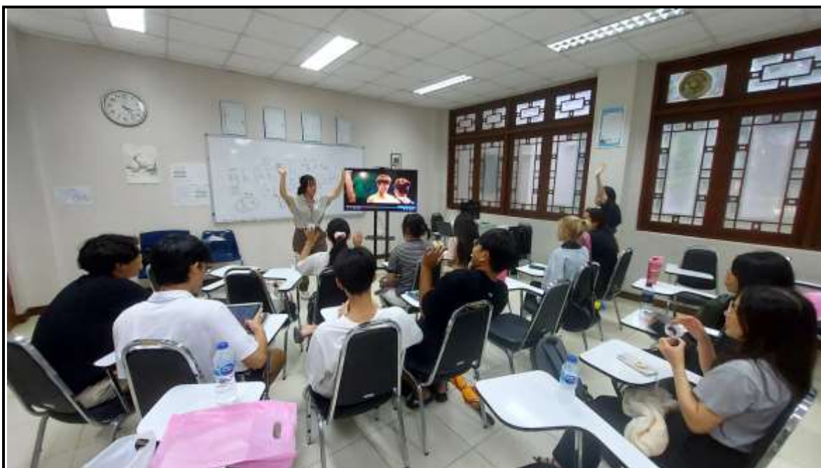
(圖四) 電影華語文化課，觀後討論中。