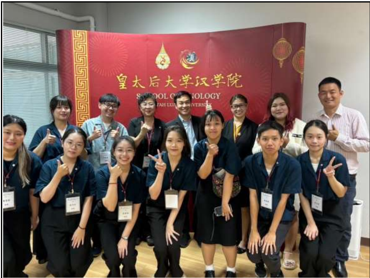
(圖六)團隊與皇太后大學師長合照