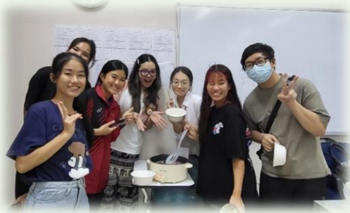
★元宵文化課搓湯圓