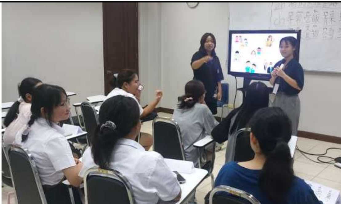
(圖二)語言課課堂活動。