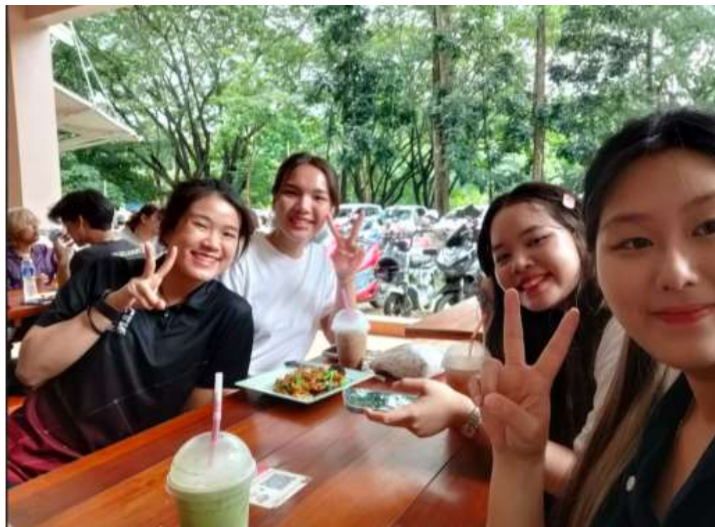
語言學伴——〈共餐學華語〉用餐時間與學生聊臺、泰飲食文化的差異