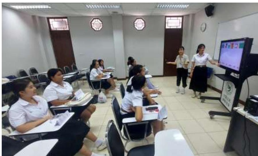
(圖三)語言課課堂活動。