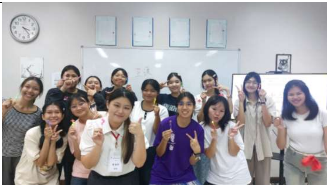
文化課程——中華十二生肖與學生捏製麵人