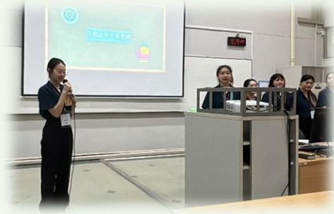
★第一次正式向大家自我介紹