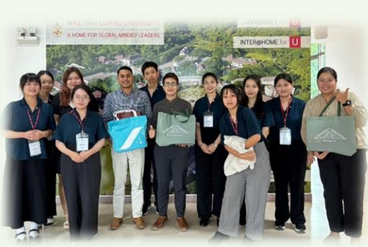
★和國際處開會見面