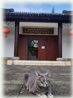
★ 孔院門口 & 貓咪童恩