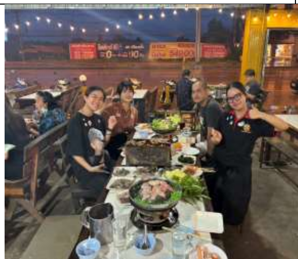
語言學伴課程：共餐華語