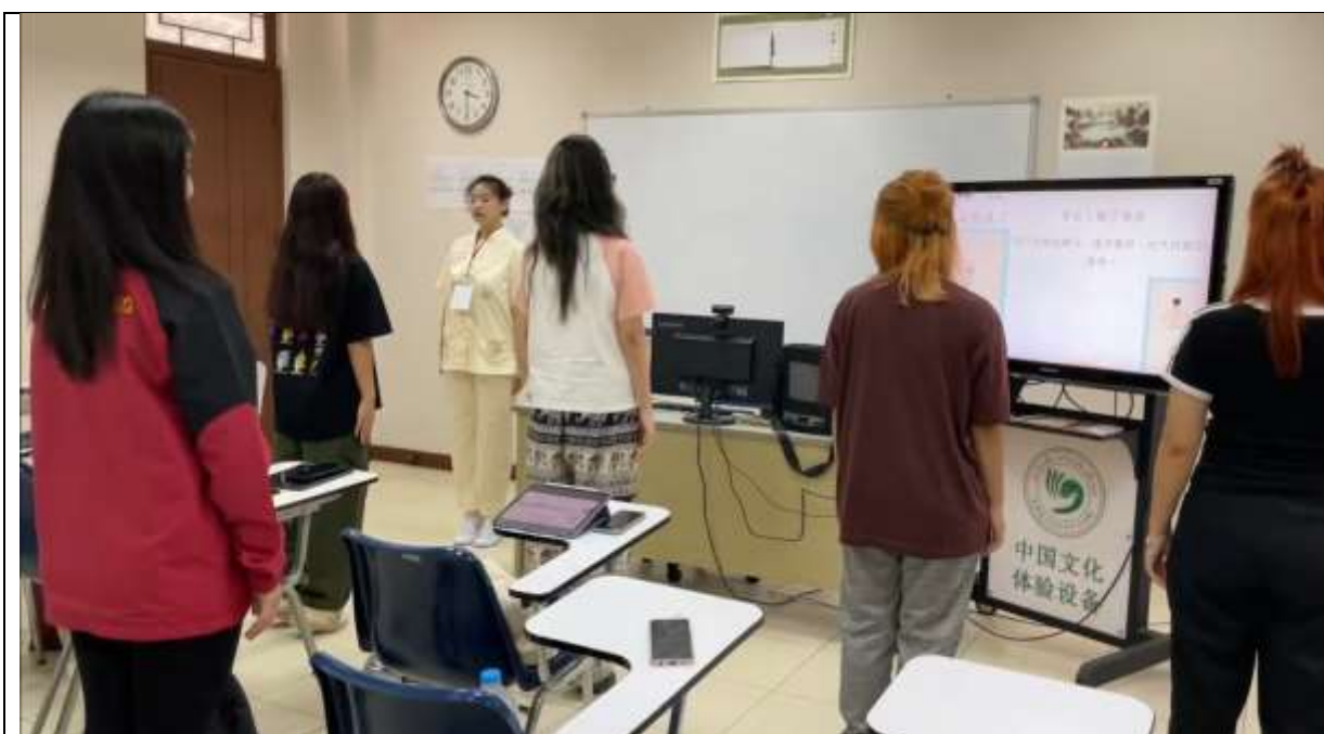
參與泰國皇太后大學國際文化日/以本校華語系參展擺攤