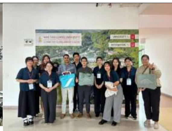
團隊與皇太后大學國際事務處合影