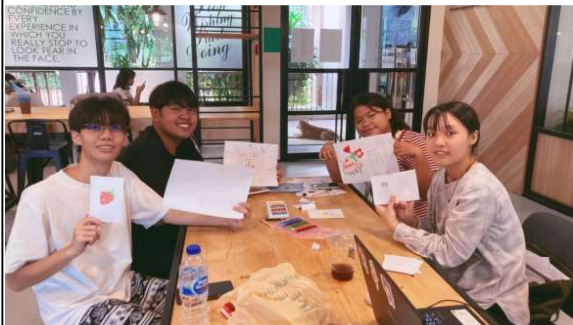
(圖五) 語言學伴，畫畫學華語。