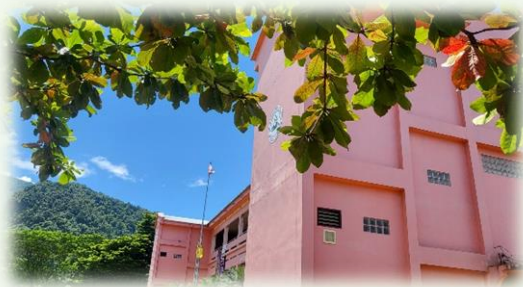
★泰北建華高中參訪