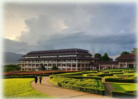
★美麗的皇太后校園