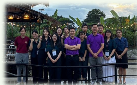
★最後的時光和院長共餐