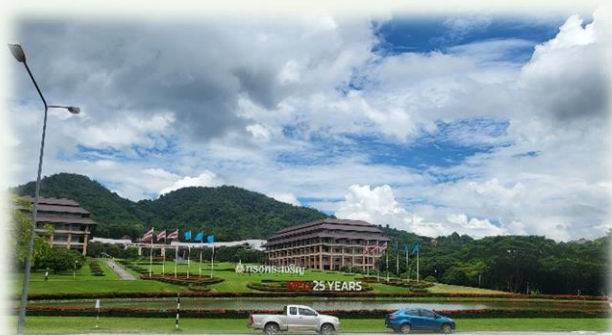
★ MFU 皇太后大學

這次主要在皇太后大學實習的學院為漢學院，該學院旨在培養與中國學有關的畢業生，教學範圍包括行政、政治、經濟、社會和對外關係等問題，使學生對中國思維方式和中文有深刻的理解和研究。