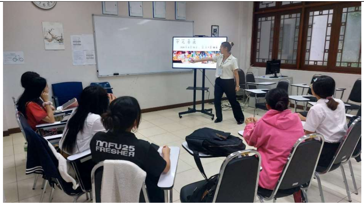
語言學伴帶領__主題:運動學華語