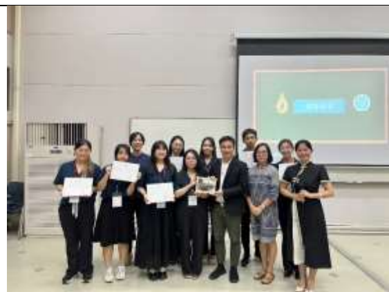
團隊與皇太后大學漢學院院長與老師合影