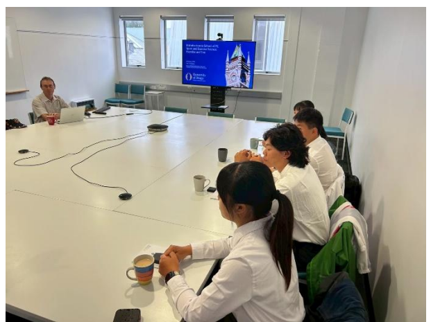
介紹過程參與實習學生專注聆聽