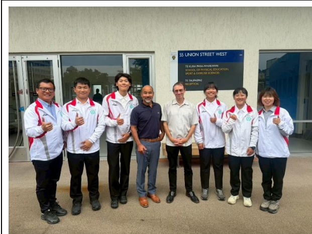
本校人員與該系主任及負責老師合影