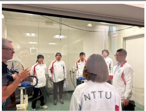
熱實驗室的介紹與體驗