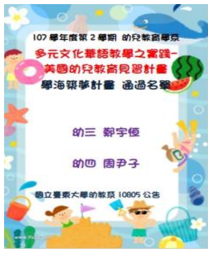
照片說明:通過名單海報