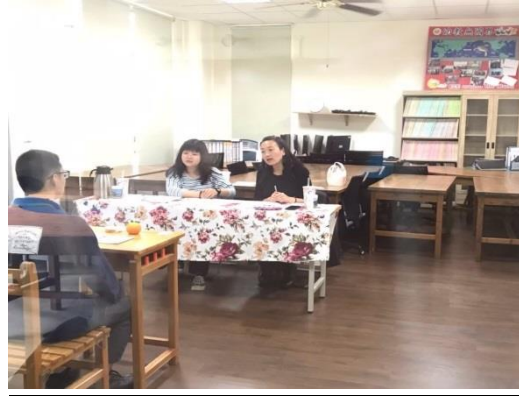
照片說明:甄選面試試教