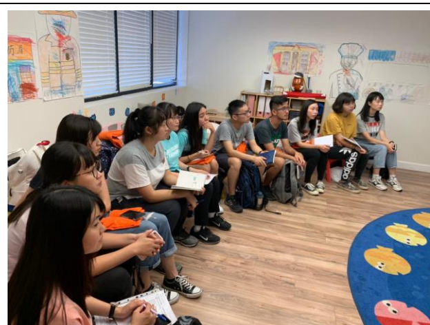
美國實習機構行前培訓