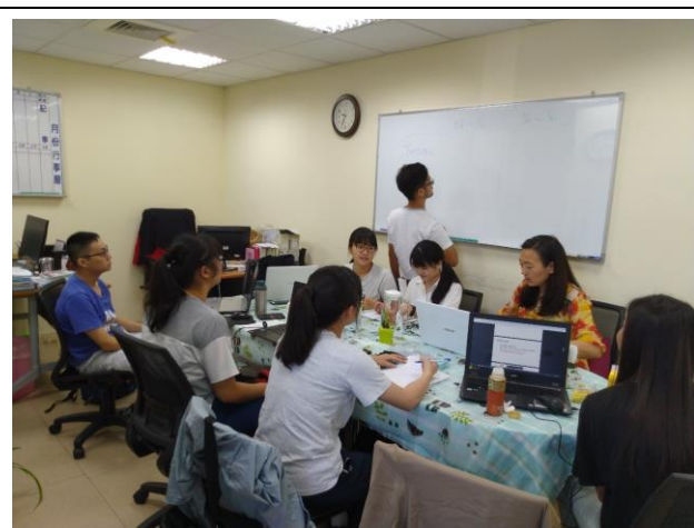
美國機構行前說明會