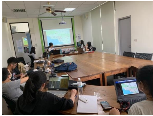
照片說明:行前說明會