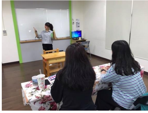
照片說明:甄選面試試教