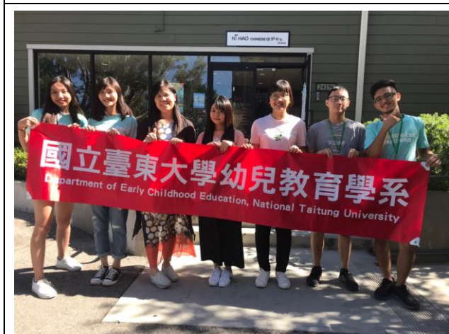
美國實習機構報到