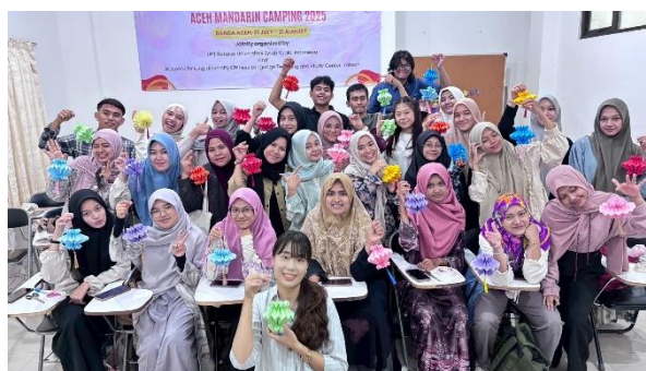
（文化課與學生成品共同合照）