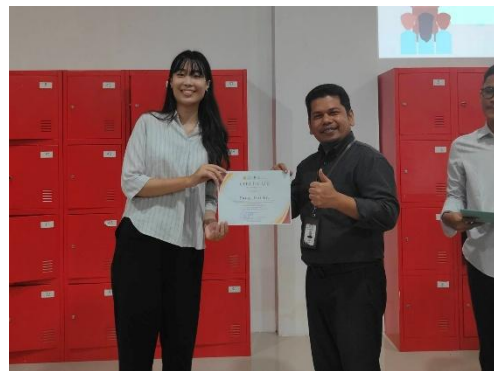
（亞齊大學頒發實習證明）