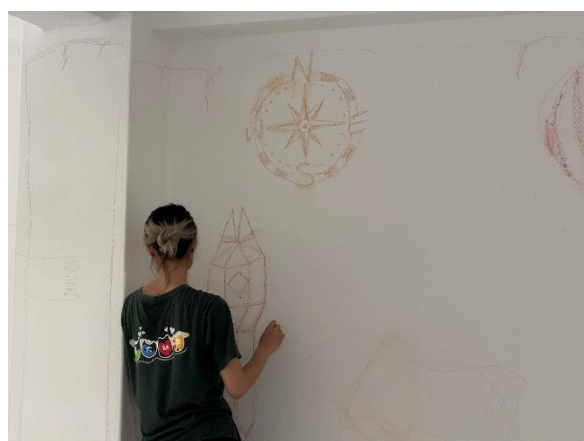
繪製幼幼班牆面1草稿