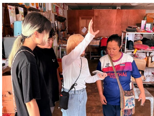
與班級老師討論設計圖