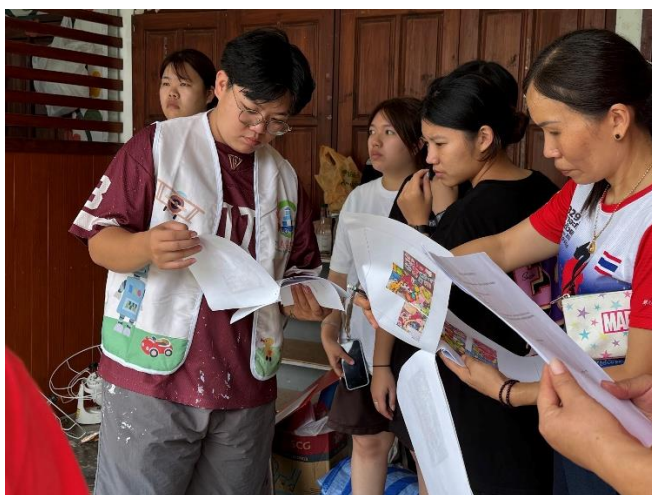
與幼兒園老師交流遊戲屋使用方式