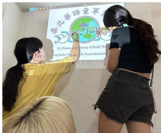
繪製童軍教室草稿