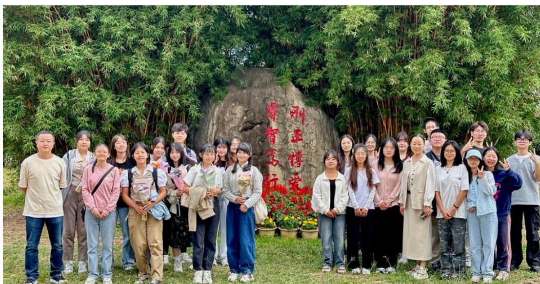
與曲靖師範學院師生們合影