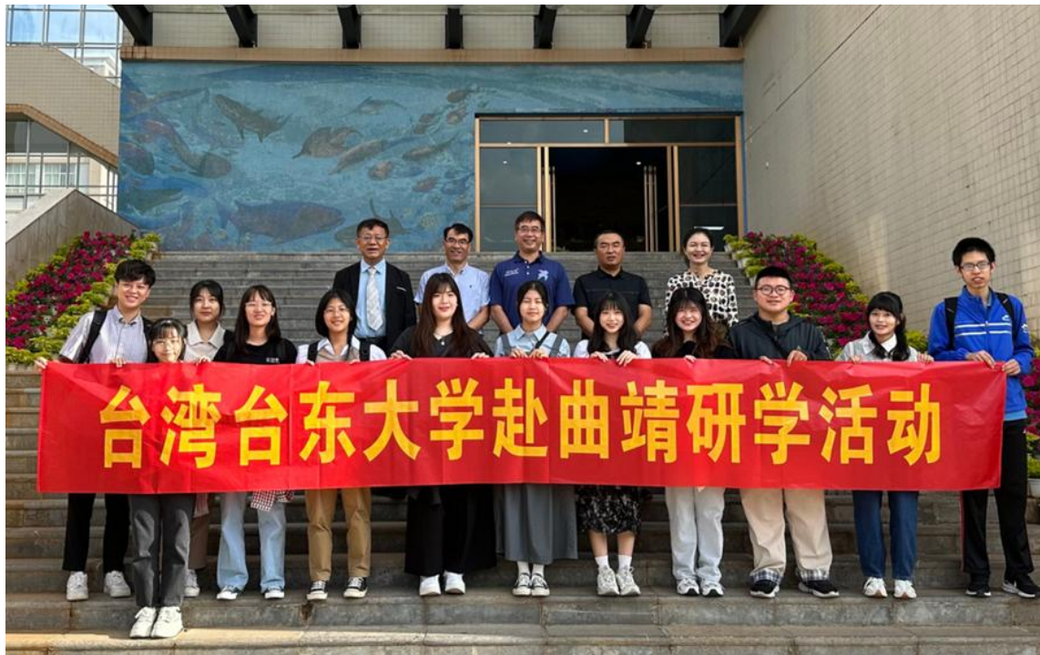
與曲靖師範學院教授們合影

臺東大學教育學系境外移地教學團至曲靖師範學院參訪交流，並由曲靖師範學院的師生們帶領參觀校園。並參觀曲靖師範學院十分知名的古魚王國博物院，感受傳統文化，並了解中國鄉村從脫貧攻堅到鄉村振興取得的豐碩成果。