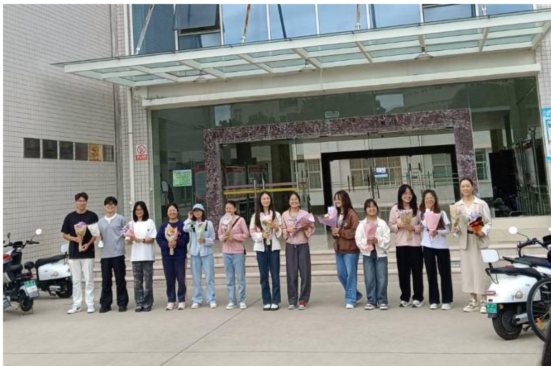
師院學生帶著自己折的花迎接東大學生