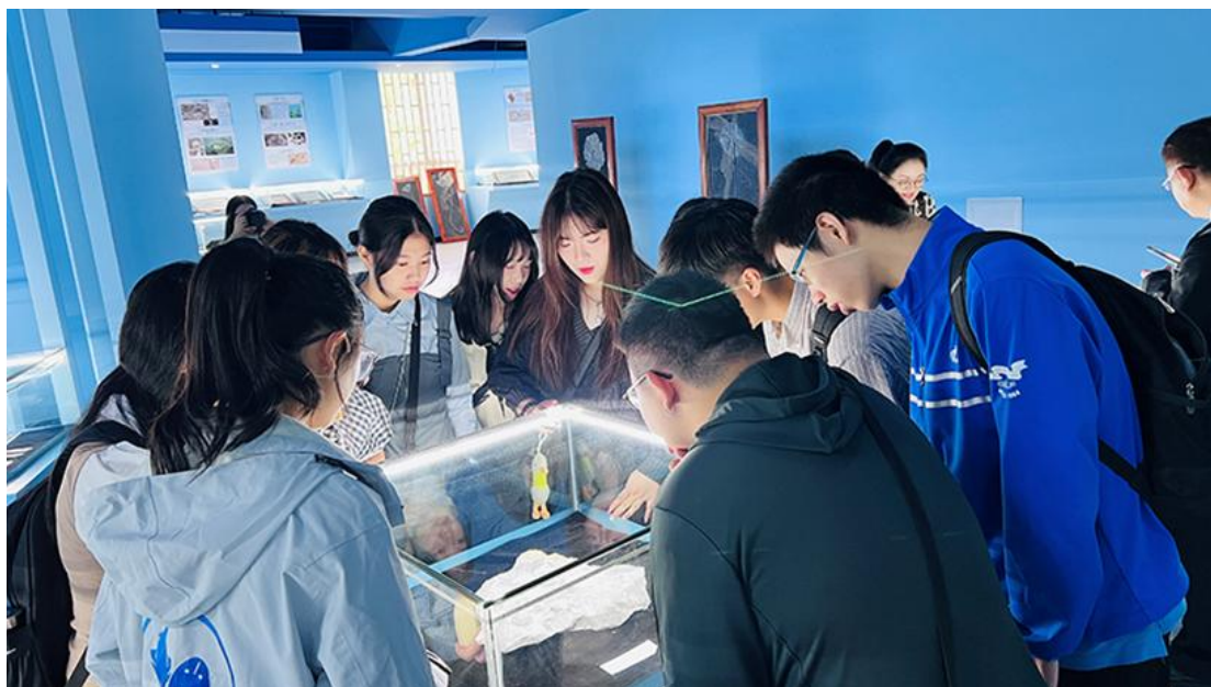
參觀古魚王國博物院