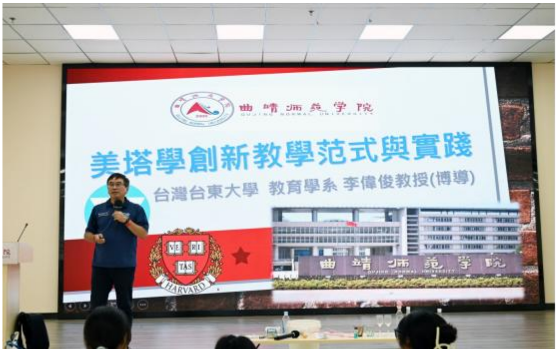
《美塔學創意教學範式與實踐》專題講座