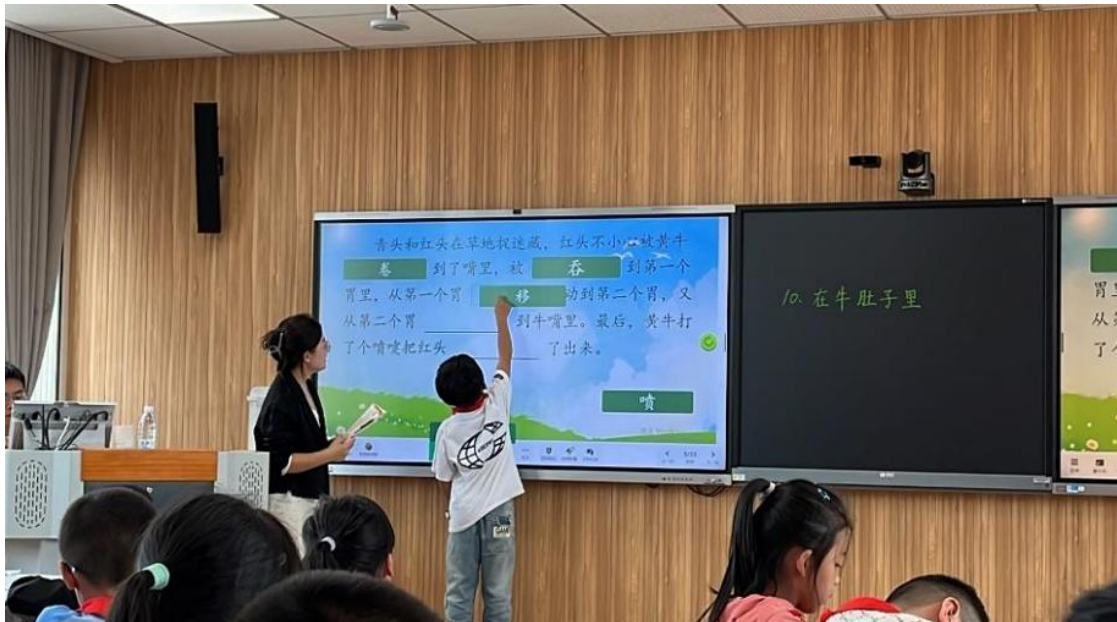
學生操作電子白板答題