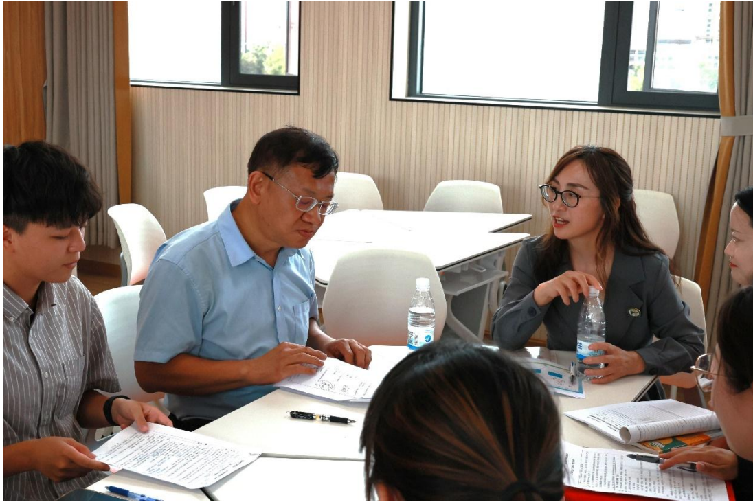
曲師附小觀課後的議課