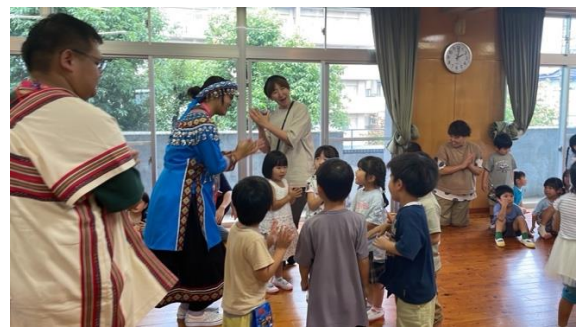
與幼兒進行舞蹈交流