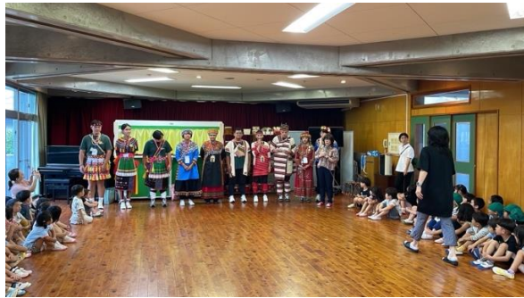
與師生們自我介紹並介紹台灣