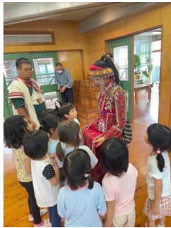
讓幼兒體驗原住民服飾