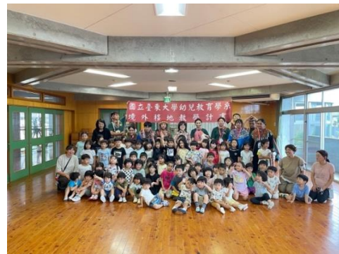
與幼兒園師生合影