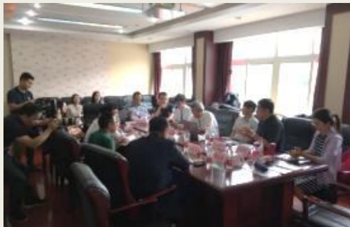
授課前的小型座談