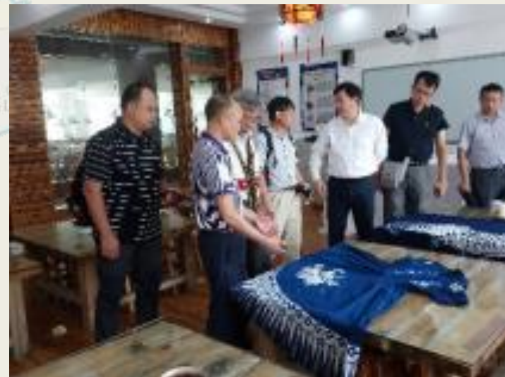
參訪彭水職教中心 蠟染實訓室