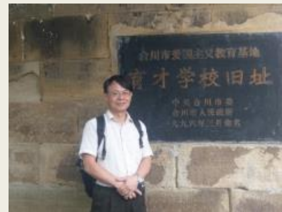
參訪育才學校舊址