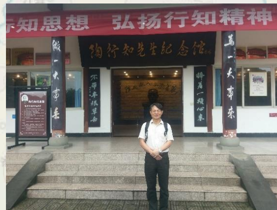
參訪陶行知紀念館