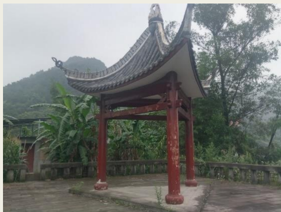
參訪 國立音樂院舊址