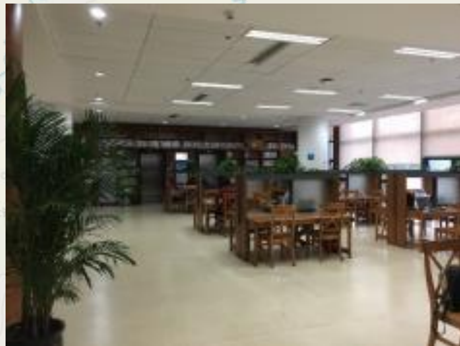
進入圖書館查詢研究資料