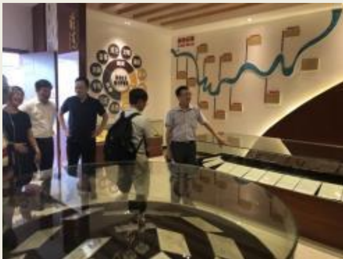
參訪彭水第三小學校史室