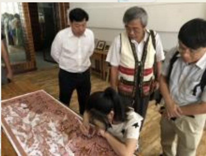
參訪彭水職教中心 剪紙實訓室