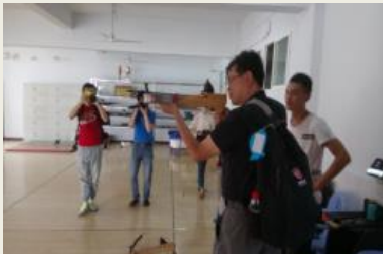
參訪彭水職教中心 民族體育射弩訓練基地