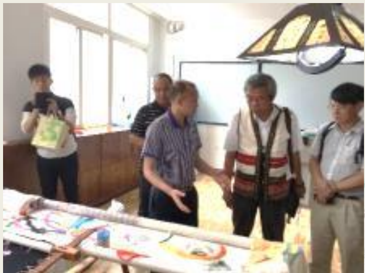
參訪彭水職教中心 刺繡實訓室