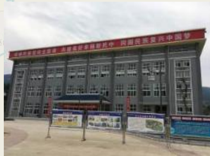
參訪彭水民族中學 教學大樓