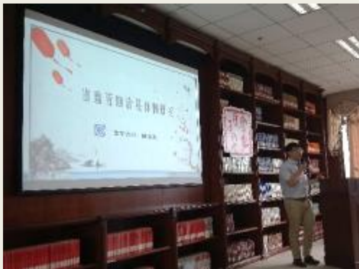
西南大學陳永亮教授 論文分享