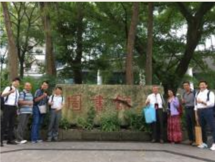
西南大學圖書館前合影留念