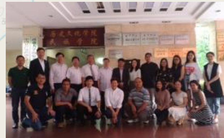
課後與授課教授專家 合影留念