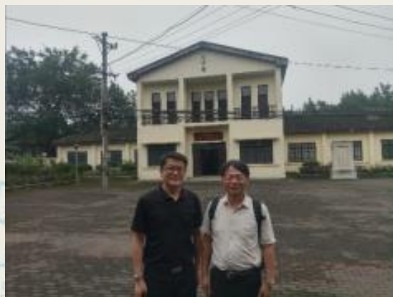
參訪抗戰時期 復旦大學舊址