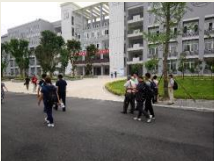
參訪彭水民族中學 辦公大樓