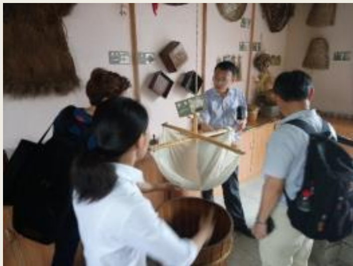
參訪彭水第三小學 食農教育區：以前的農用 器具