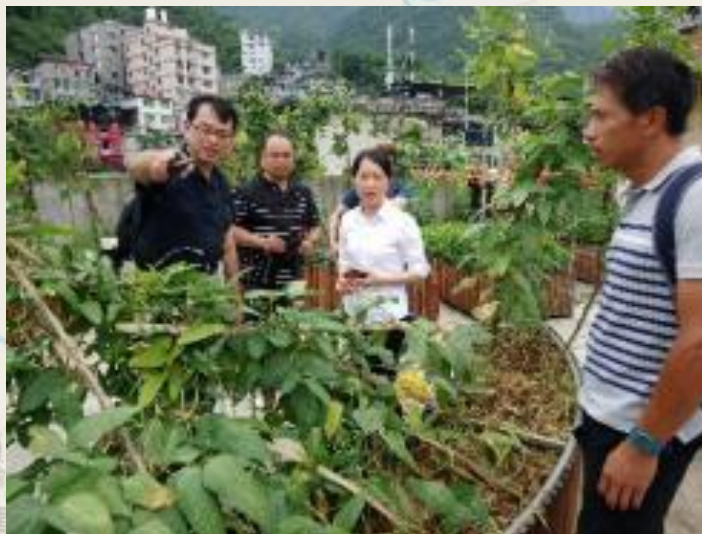
參訪彭水第三小學食農教 育區：頂樓菜園