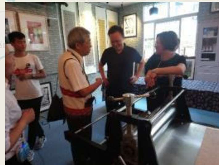
參訪彭水第三小學 版畫教室