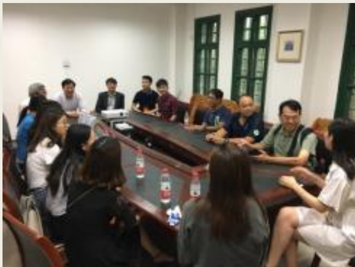
參訪田阡主任研究室