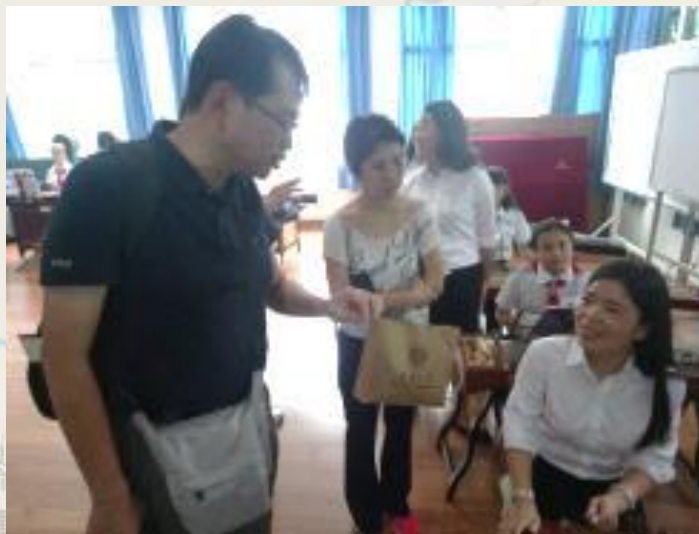
參訪彭水第三小學 音樂教室